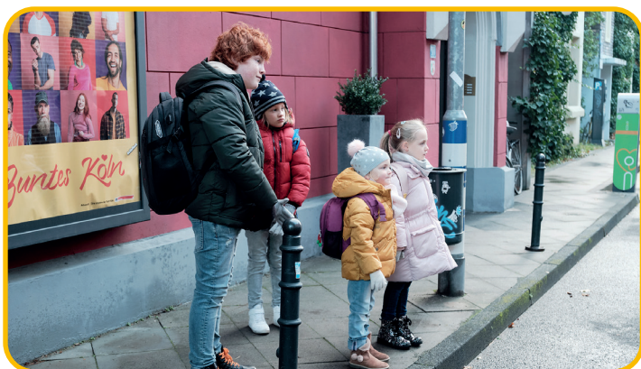
Auf ihrem fröhlichen Weg in Kindergarten und Schule ahnen Julius und die Kids noch nichts.

Nein, der Fokus von „Unter uns“ ist und bleibt auf den Geschichten rund um die Familie, die Nachbarschaft, die Freundschaft und die Liebe – das sind die verlässlichen Säulen von „Unter uns“. Eine gute Prise Humor darf natürlich auch nicht fehlen. Neue Gesichter und neue Stories werden auch weiterhin der Motor von „Unter uns“ sein.